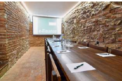
eFi Palace Hotel ***, salonek v restauraci