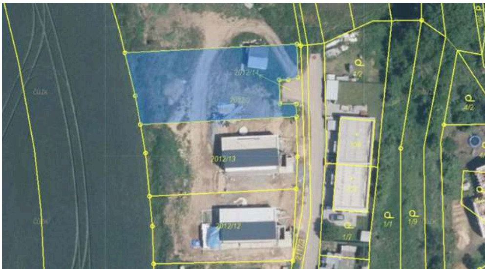
Katastrální mapa pozemku v Tučapech