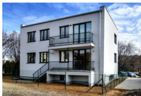
Novostavba se 3 byty, Bílovice n. Svitavou

KONCERN E-FINANCE, A.S. JE INVESTIČNÍ REALITNÍ SKUPINOU PŮSOBÍCÍ NA ČESKÉM TRHU JIŽ OD ROKU 2001. PORTFOLIO DOKONČENÝCH A PRONAJÍMANÝCH NEMOVITOSTÍ SKUPINY E-FINANCE, A.S. DLE ZNALECKÝCH POSUDKŮ JIŽ PŘESAHUJE HODNOTU 1,7 MILIARD KORUN. HODNOTA VŠECH REALITNÍCH PROJEKTŮ VČETNĚ TĚCH, KTERÉ JSOU V PŘÍPRAVĚ A VÝSTAVBĚ, PŘESAHUJE HODNOTU 2,3 MILIARDY KORUN.