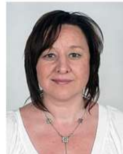
Tel.: 723 271 115 E: zaveska@e-finance.eu