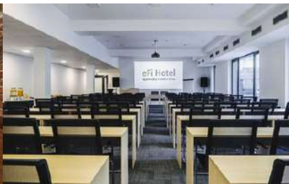
eFi Palace Hotel***, kongresový sál