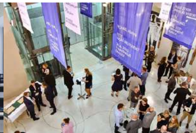
Divadlo Reduta, foye i přilehlé sály