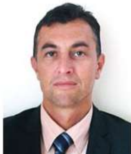
Tel.: 602 757 608 E: barsa@e-finance.eu

S dobře vybraným pojištěním si užijete hory bez starostí a budete se moci soustředit na zábavu a odpočinek.