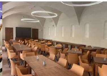
Zámek Račice, sál Konírna

KONCERN E-FINANCE, A.S. JE INVESTIČNÍ REALITNÍ SKUPINOU PŮSOBÍCÍ NA ČESKÉM TRHU JIŽ OD ROKU 2001. PORTFOLIO DOKONČENÝCH A PRONAJÍMANÝCH NEMOVITOSTÍ SKUPINY E-FINANCE, A.S. DLE ZNALECKÝCH POSUDKŮ JIŽ PŘESAHUJE HODNOTU 1,7 MILIARD KORUN. HODNOTA VŠECH REALITNÍCH PROJEKTŮ VČETNĚ TĚCH, KTERÉ JSOU V PŘÍPRAVĚ A VÝSTAVBĚ, PŘESAHUJE HODNOTU 2,3 MILIARDY KORUN.